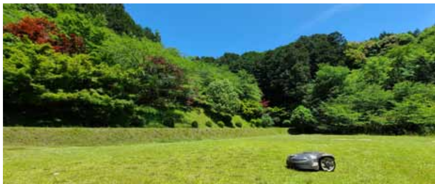
草刈ロボット「刈り上げくん」も大活躍