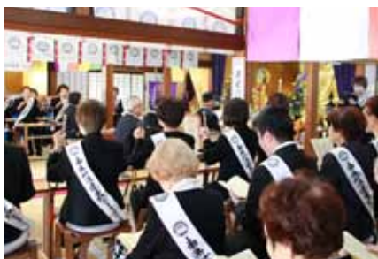
祈りを捧げる本堂の風景