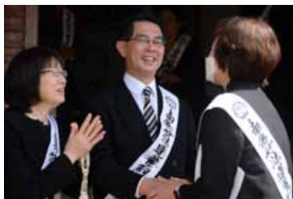
お出迎えされる会長先生ご夫妻