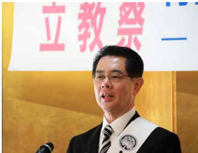
ご真教法話をされる会長先生

四月十四日（日）真生会創立 四十五周年記念立教祭が穏やかな晴 天に恵まれ開催されました。