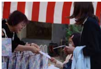
ようこそ総本山へ、ご供物授与