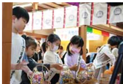
真剣な面持ちで子供奉獻の儀