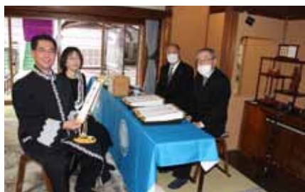
仏さまの声、金色短冊を拝受