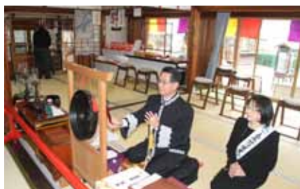
健康長寿の福聚の鐘初うち