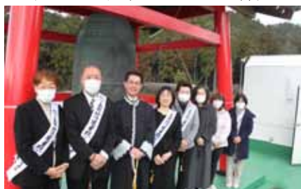
役員皆さんも新年初鐘うち