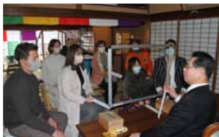
長寿健康の福聚の鐘と短冊を拝受