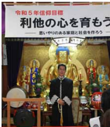
ご真教法話をされる会長先生