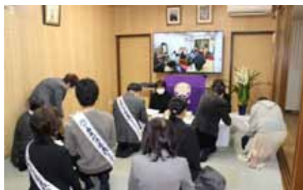
新年の短冊を引かれるご信者